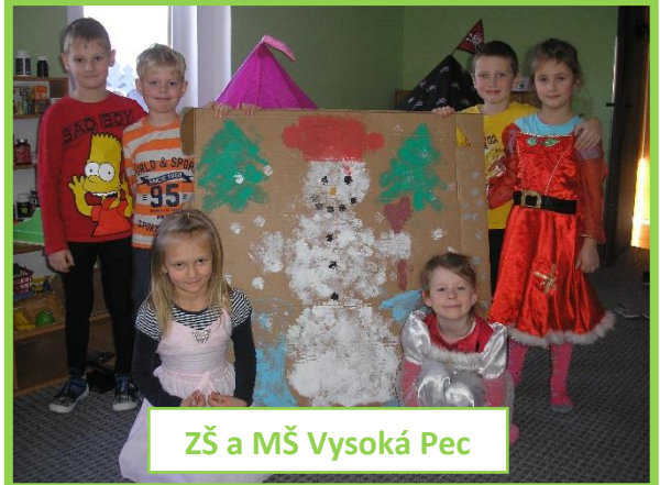
ZŠ a MŠ Vysoká Pec